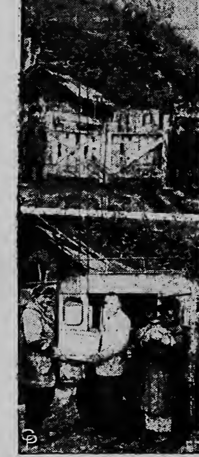
PUNTO DI CONTROL NA FRONTERA: — Guardianan Indio ta para na e porta cu ta cera un caminda cu ta separa India for di Tibet. Aha medicina ta wordé carga tras dje punto di control Indio y nan ta wordé entrega na e oficialnan. A wordé reporta cu e Partisannan Tibetano ta grupando na algun dje lugarnan cu nan por sconde aden den Himalaya pa nan sigui ataca e Comunistanan Chines.